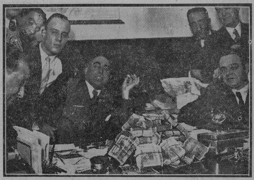
EL ATRACO AL AYUNTAMIENTO DE MADRID.—Montón de billetes recogidos por la Policía y que fueron robados de la camioneta municipal.

Por pequeño que sea vuestro donativo el Ateneo lo necesita para los Reyes.