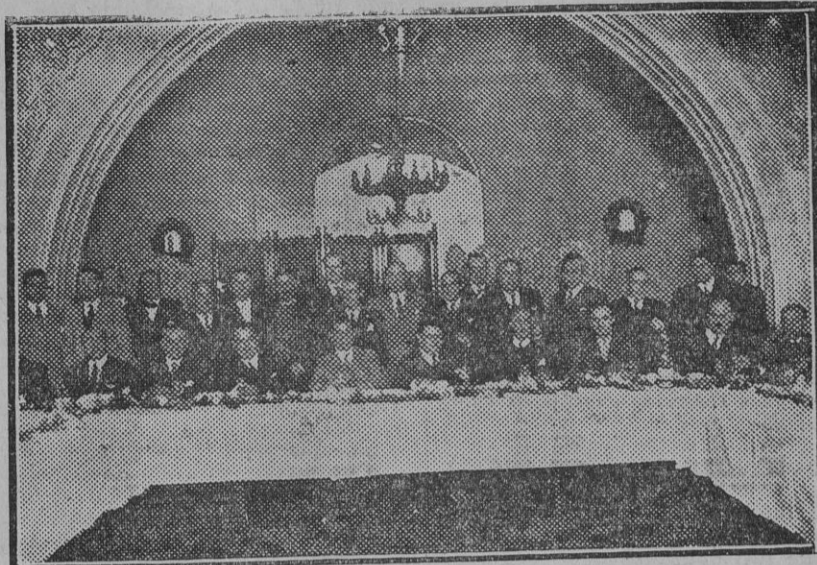
El banquete con que la Cámara Sindical del Automóvil obsequió á los representantes forasteros y diputados á Cortes.

En cuanto al tercer punto de la nota, en el que se afirma que las disposiciones obedecieron á estudios previos advertidos por el voto de los autotransportistas, lo califica de falso. Se refiere después á la Comisión de Coordinación del transporte por carretera y ferrocarril, de la que dice que ya se llama por los empleados del ministerio Comisión de Subordinación del transporte por carretera