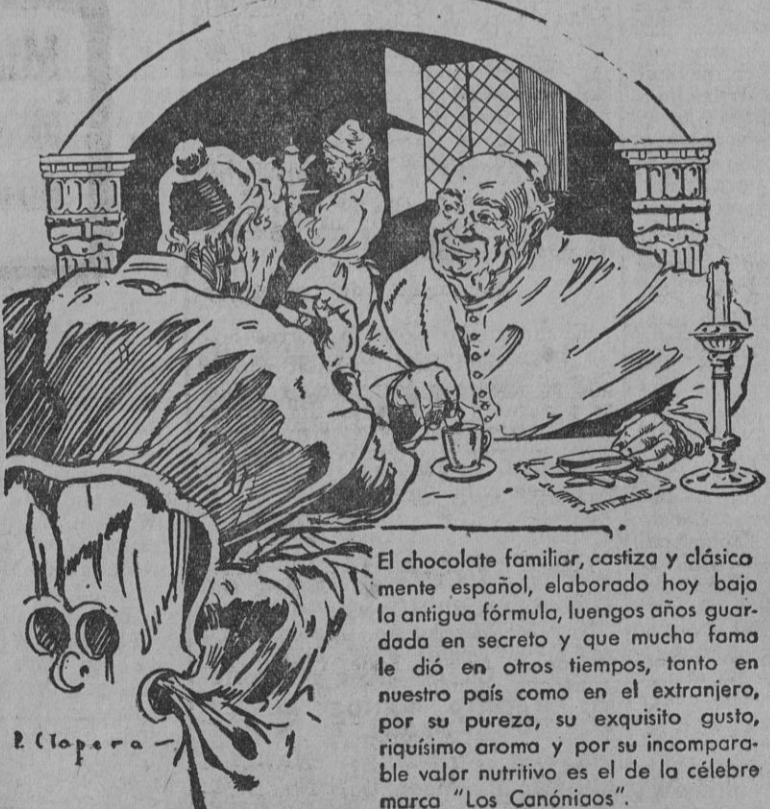
"Una jarra de chocolate 'Los Canónigos' es otra de las delicias de España."