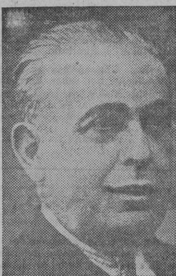
Don Joaquín Chapaprieta, que ha recibido de S. E. el encargo de formar Gobierno al resignar los poderes el presidente de las Cortes, don Santiago Alba.

—Yo le he dicho que no me consideraba con méritos ni condiciones para el encargo y prefería seguir laborando al frente del ministerio de Hacienda. El señor Presidente ha