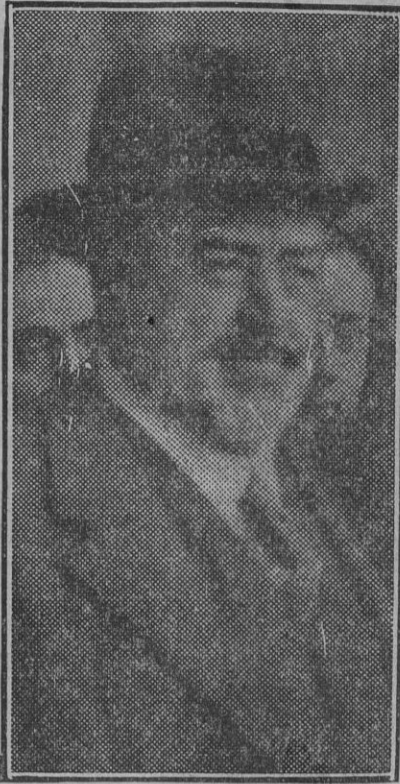
El presidente de las Cortes, don Santiago Alba, á quien el Jefe del Estado confirió encargo de formar nuevo Gobierno, cuyas gestiones continúa en la tarde de hoy.

Bandas de foragidos han levantado los carriles en la parte Sur de la línea, haciendo descarrilar el tren. Veinticinco personas han resultado muertas ó heridas. Los bandidos han huido, raptando a siete viajeros.