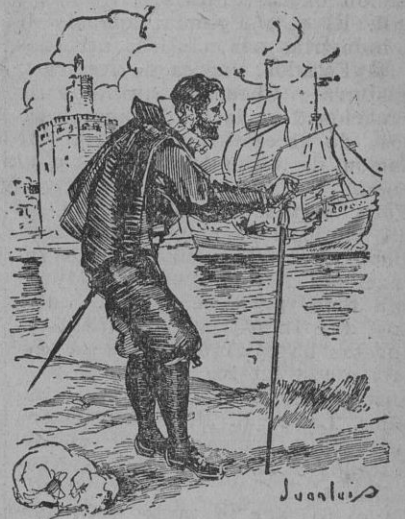
El alcalde de río y mar.

haredad, por propios suyos y con facultad de nombrar persona que lo sirva y ejerza; y sin que por mí, ni por los reyes que después de mí vinieren, con motivo alguno, pretexto ó causa, se la inquiete ni pueda inquietarse en su justa posesión; por declarar como declaro que debe ser libre del decreto de incorporación de lo enajenado de mi Real Corona, por razón del servicio hecho á ella de los tres mil ducados.»