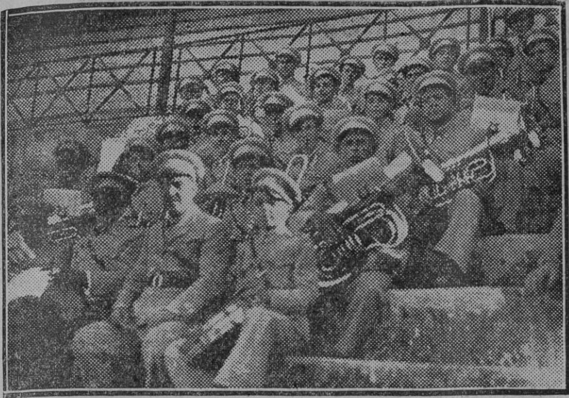
La banda municipal de Carmona, que en el concurso de bandas municipales celebrado en Sanlúcar de Barrameda ganó el segundo premio.