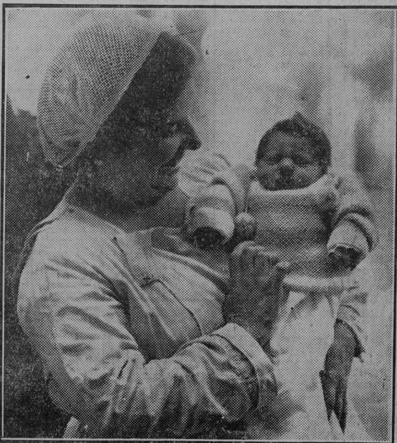
La niña encontrada anoche en la calle Mariano de Cavia, en brazos de una «nurse» de la Casa Ouna.