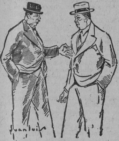
El dibujante «se acuesta a las ocho»; pero antes ha visto este apunte.