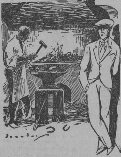
—Antes «trabajaba en la fragua de mi cuñado.

sus éxitos con esa pajolera gracia que Faraón le ha dao á esta gente de su raza.