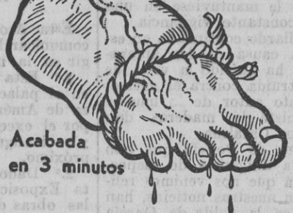
Acabada en 3 minutos

No se desesperen ustedes, pues pasaron ya aquellos tiempos en que era inevitable aguantar un suplicio de tortura en los pies! Actualmente, puede usted librarse en el acto de las peores hinchazones, quemazón y demás dolores en los pies sensibles, sea cual fuere la causa. Compre simplemente un paquete de Saltratos Rodell y eche un puñado de los mismos en agua caliente para un baño de pies. En el instante en que usted sumerja los pies en este baño oxigenado y curativo, cesará toda inflamación en sus tejidos irritados, se restablecerá la circulación sanguínea de tal forma, que sus pies se encontrarán calmados y remozados. Con esta sencilla receta, diariamente millares de pacientes encuentran alivio en tres minutos, cuando vivían desesperados por creer que no había medio de poner término á sus males de pies. Los callos y durezas se reblandecen, pudiendo extirparse por completo. Los Saltratos Rodell son de éxito seguro y por eso podemos garantizar su resultado. Adquiera hoy mismo un paquete de estas maravillosas sales y empiece el tratamiento esta noche y se vencerá. Los Saltratos Rodell se recomiendan y venden, á un precio insignificante, en todas las farmacias, droguerías, perfumerías y Centros de específicos.