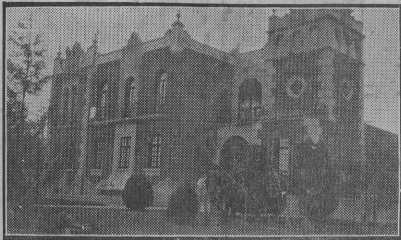
Residencia particular del general e ingeniero don Manuel Pérez Treviño, nuevo embajador de los Estados Unidos Mejicanos en España.

Don Manuel Pérez Treviño, con la bondad y sencillez que le caracteriza, me recibe en su hermosa residencia en las Lomas de Chapultepec, con jardines de múltiples flores, arcadas, patios y fuentes, entre ellas una copia de la de «Las ranas», del Parque de Sevilla.