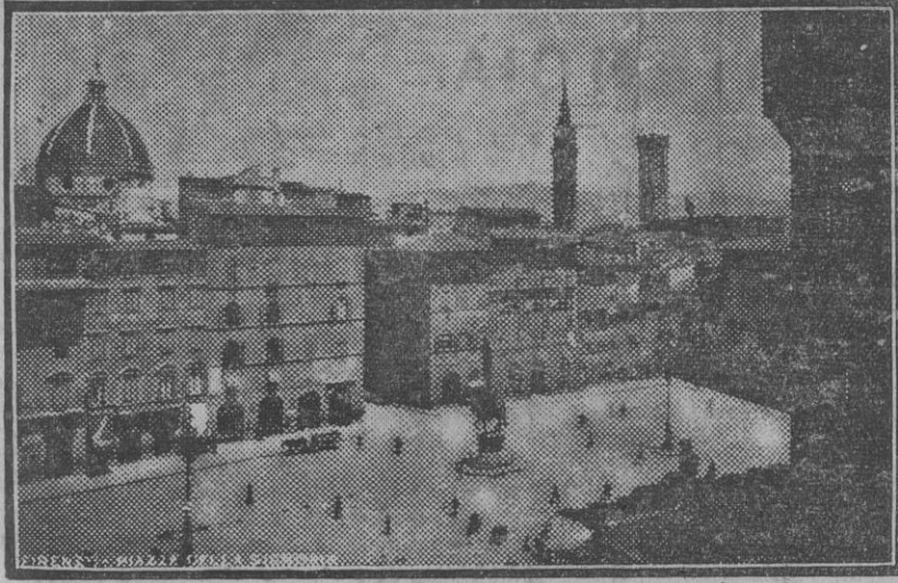
Florenca: Perspectiva de la bella y artística plaza de la Señoría, cuyo fondo se destacan la cúpula de la iglesia de Santa Cruz y las torres de otros templos.