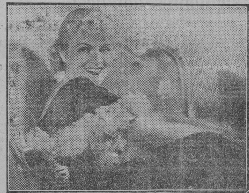
Claire Trevor, la deliciosa ingenua de las comedias cinematográficas americanas.

Viena.—La «Wiener Neueste Nachrichten», diario antisemita, anuncia que los abogados arios de Viena han pedido al ministro de Justicia la creación de una Cámara de abogados de raza aria, independiente de la Cámara existente que comprende 1.939 abogados judíos y 305 arios.