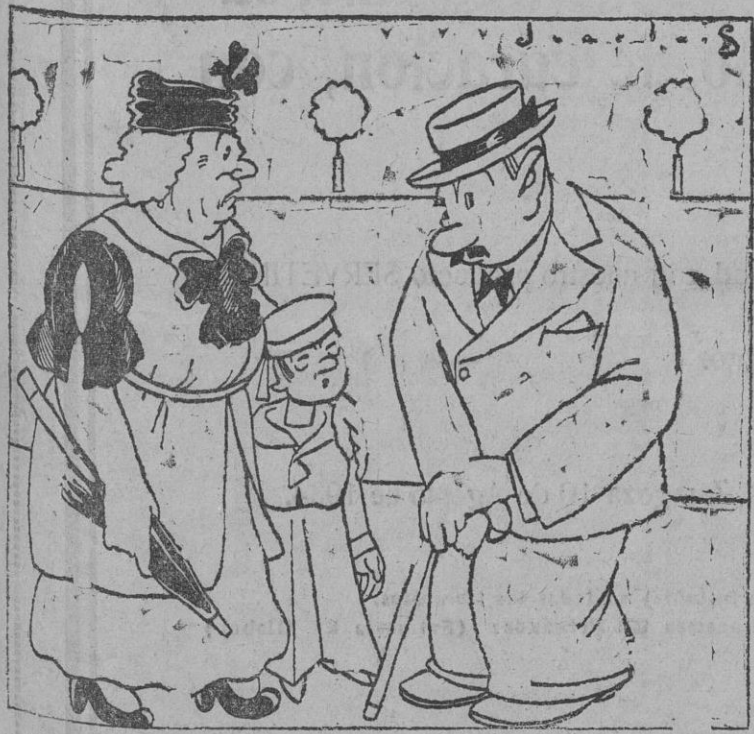
—Me he enterado de que su esposa estaba indispueta. ¿Cómo sigue? —Acabando... Acabando con mi paciencia.

LEA V. MAÑANA «EL LIBERAL» EL DIARIO MEJOR INFORMADO