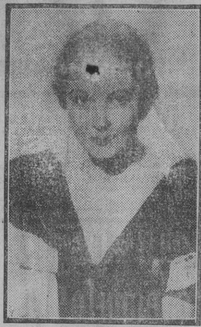
Evelyn Venable, alta, gentil, llena de sencillez y elegancia, es una de las pocas «estrellas» que, según se asegura, odia el besar y ser besada...

Esta tarde ha tenido lugar el acto de dar cristiana sepultura en el cementerio municipal al cadáver del finado, resultando una verdadera manifestación de duelo, por el número y calidad de personas que han