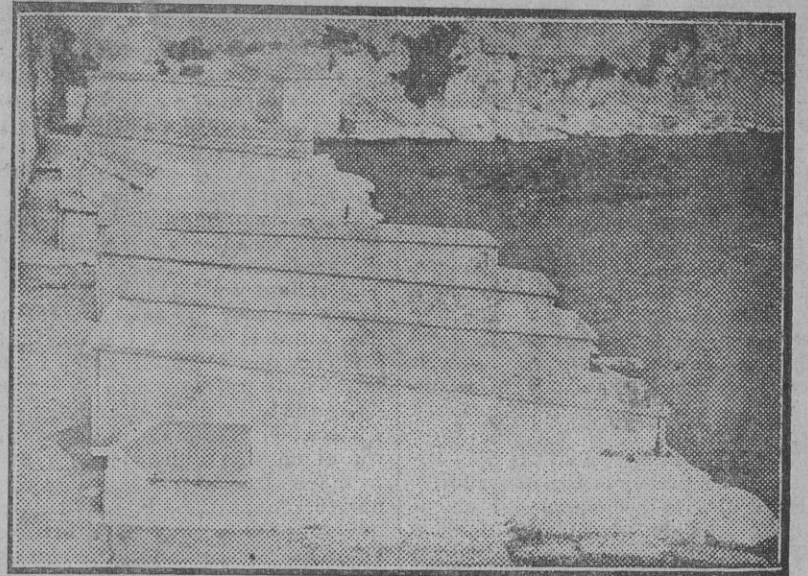
El Cementerio de los hebreos.

No ha de ser gran cosa el ingreso porque la colonia israelita es muy pequeña; pero como un detalle curioso, hemos querido destacar este detalle.