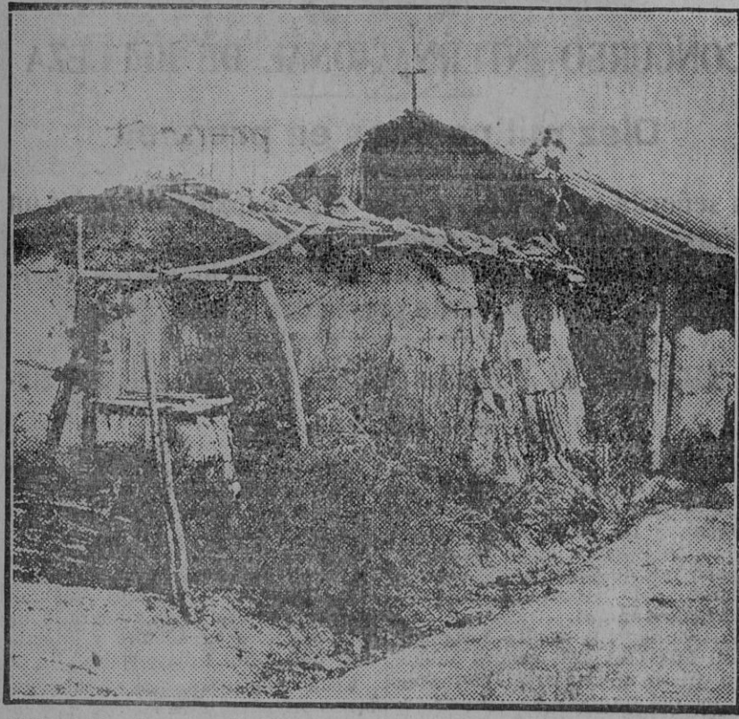
Villa Pulmonia, una de las casas de la alegre y típica barriada. ¿Se puede vivir así?