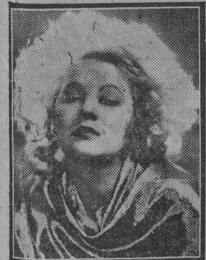
Greta Nissen, del cinema americano