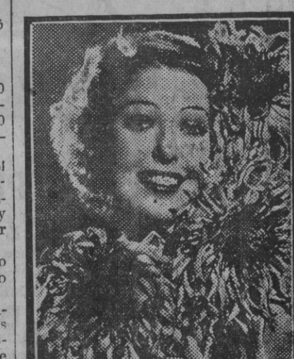
La estrella Loretta Young