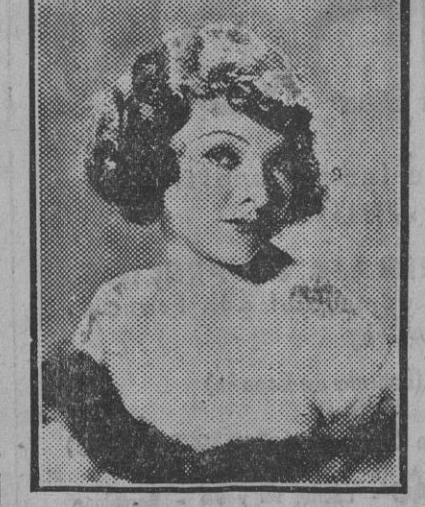
Myrna Loy, actriz de la pantalla, en su consagración definitiva se acerca