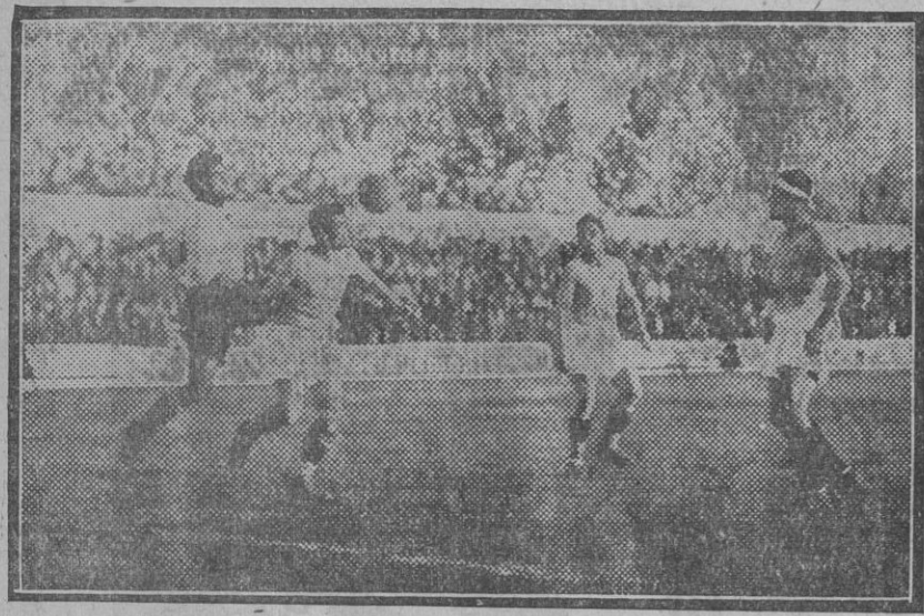
Campanal tuvo que desmenuzarse en todo momento rodeado de contrarios. Aquí, mientras un gallego trata de despojarse del cuero, otros dos permanecen á la expectativa.