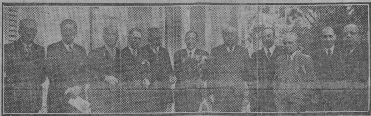
El nuevo Consejo de ministros, después de celebrar la primera reunión ministerial en la Presidencia (Fdo. Gori.)