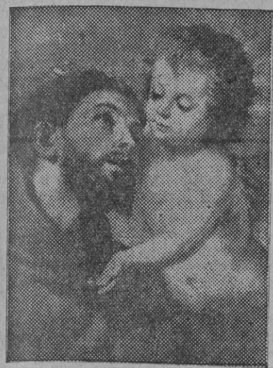
El famoso San Antonio, de Murillo.

Puede decirse que una de las devociones más arraigadas y populares en España es la devoción que se tiene a San Antonio.