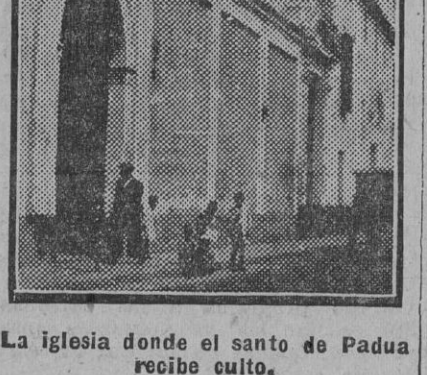
La iglesia donde el santo de Padua recibe culto.