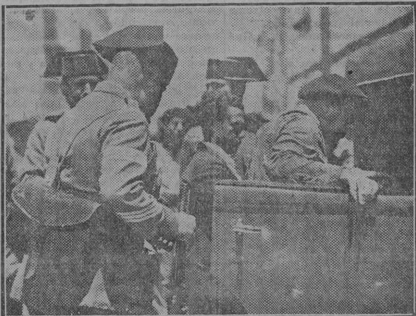
Los detenidos en el momento de ser trasladados á Sevilla.

Tres guardias de Gines y otros tres de San Juan pasaron al término de Bormujos y tres de este