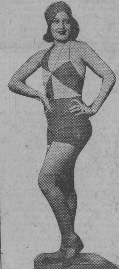
Merna Kennedy, juvenil estrella, de arrogante figura.

A propuesta de la Comisión de Policía de Subsistencias, y con el fin de facilitar el aprovisionamiento de artículos comestibles—este veintiduro, el domingo próximo, 30 de los corrientes, estarán abiertos los Mercados de Abastos durante las horas ordinarias, a igual que los días laborales, por el despacho al público de aquellos artículos cuyos distintos precios no tengan concertado pacto en contrario que les exima del cumplimiento de esta disposición.