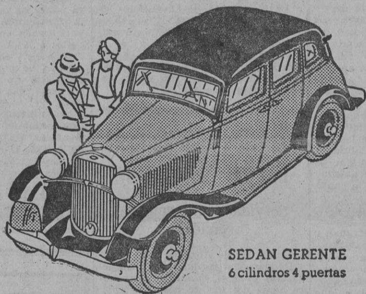
SEDAN GERENTE 6 cilindros 4 puertas

Once son los modelos, incluyendo los cuatro de la serie Gerente de lujo, entre los que puede usted escoger. De estilo moderno, — perfectamente acabados — las carrocerías de madera dura y acero son