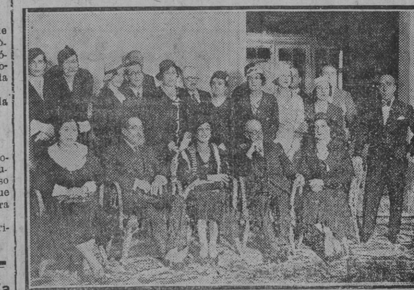
MADRID.—Grupo de concurrentes a la fiesta celebrada en honor de Antonia Mercé «Argentina» por sus triunfos artísticos en Madrid.

Fué asistido en el Prado de heridas en el pie derecho.