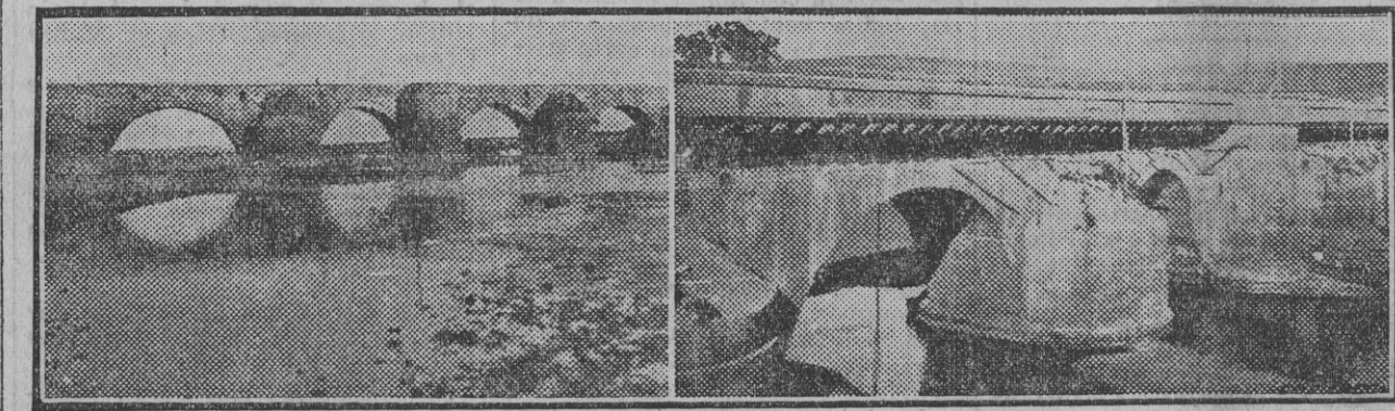
Niebla.—El puente romano de la carretera antes de la reforma y el mismo puente después de las obras ejecutadas recientemente

En el estado actual del mundo y con el ahogo de las restricciones severísimas que ponen por todas partes barreras al comercio, los mejores esfuerzos y toda la influencia del Gobierno británico y de los demás debería tender a lograr un desarme económico simultáneo. Suponiendo que una reducción importante y universal de los aranceles no fuera por ahora posible en la práctica entre todas las naciones, no es éste motivo suficiente para dejar que paralice nuestra acción conjunta. Si no todos los países, muchos de ellos reconocen ya la necesidad de la mayor libertad comercial posible; y lo que nosotros proponemos aquí es que aquellos países que reconocen esa necesidad se unan para convertirla en realidad, siquiera entre ellos mismos. Esta es la política comercial que entendemos urge adoptar. No puede llevarse a cabo, desde luego,