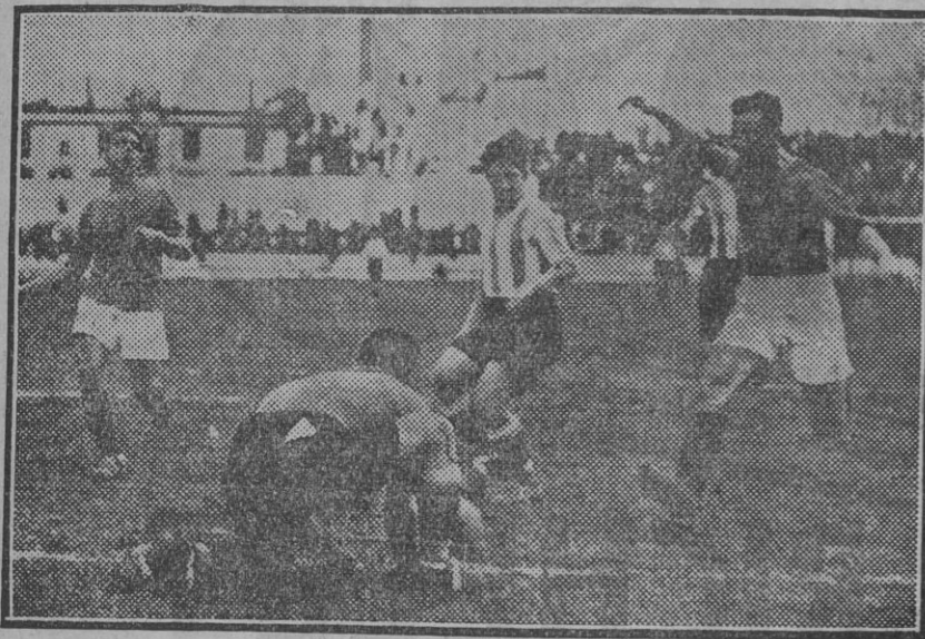
La puerta del Alavés amenazada por los béticos

El Betis venció al Deportivo Alavés por tres tantos a uno