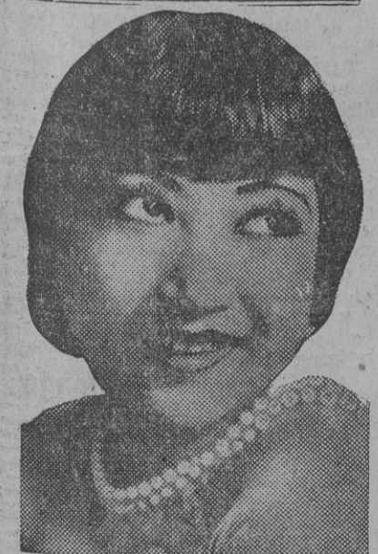
ANNA MAY WONG