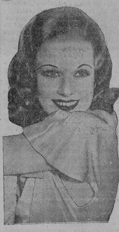
Jean Harlow, la rubia platino, cuyo nombre, con motivo del suicidio de su esposo, en condiciones excepcionales, apareció en toda la Prensa del mundo.