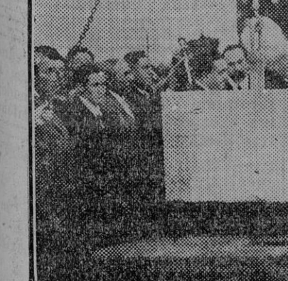
El Sr. Alcalá Zamora en la colocación de la primera piedra del Instituto de Psiquiatría, de Alcalá de Henares, acto al que concurrieron destacadas personalidades políticas, por ser obra a la que se le concede gran trascendencia

El fallo del Consejo de guerra ha sido muy favorablemente comentado por la atenuación de las penas impuestas en relación con las primeramente pedidas.