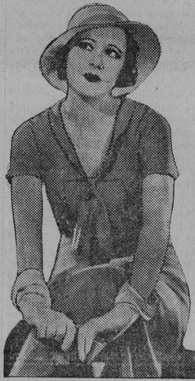
La linda Irene Dunne, una de las más jóvenes del cinema americano.