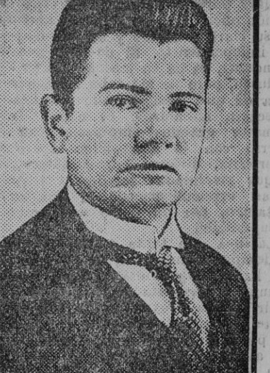
M. Voldemaras, antiguo presidente del Consejo de Lituania, que quiso, sin éxito, hacer el papel de un Mussolini, y á quien se le atribuye la inculpación de malversaciones. Se le atribuye el haber querido sustraer al Estado 53.000 coronas.