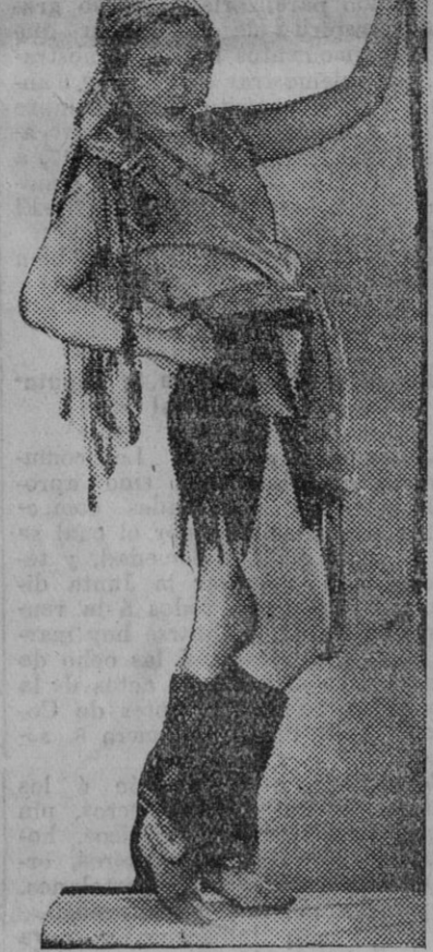
Mary Brian, una de las más sugestivas y atrayentes actrices, gusta, en su refinada coquetería, de lucir pintorescas y raras toilette.

La sesión que se ha producido en el seno del partido laborista era difícilmente evitable. Se trata de una diferencia bastante honda y extensa de conceptos casi tanto como de procedimientos. Nosotros estimamos que ha llegado la hora de que el laborismo se lance verdaderamente a la lucha y haga oír su voz bien alta, porque la situación mundial, en vez de mejorar, empeora. Y para ello los socialistas han de modificar profundamente, de «evolucionar», sus tácticas, si quieren hacer frente a las nuevas circunstancias.