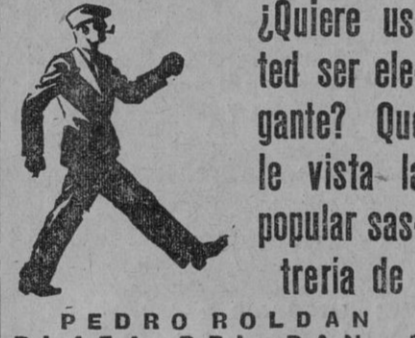
PEDRO ROLDAN PLAZA DEL PAN, 3

Ida y vuelta, en tercera clase . . . SEIS PESETAS Ida y vuelta, en segunda clase . . . DIEZ PESETAS