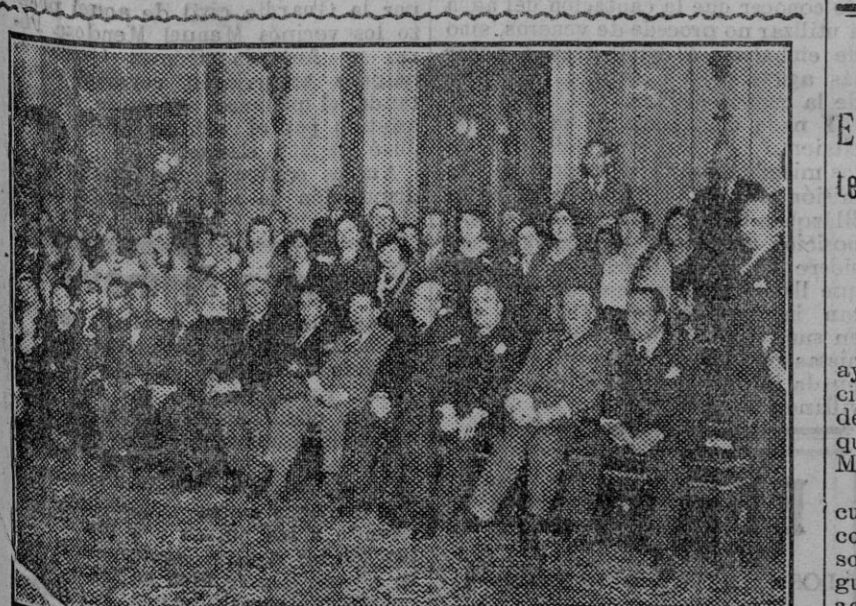
Los miembros del Congreso de titulares mercantiles que se celebra en Madrid fueron agasajados con una recepción en el Ayuntamiento, en la que la banda municipal interpretó un admirable concierto.