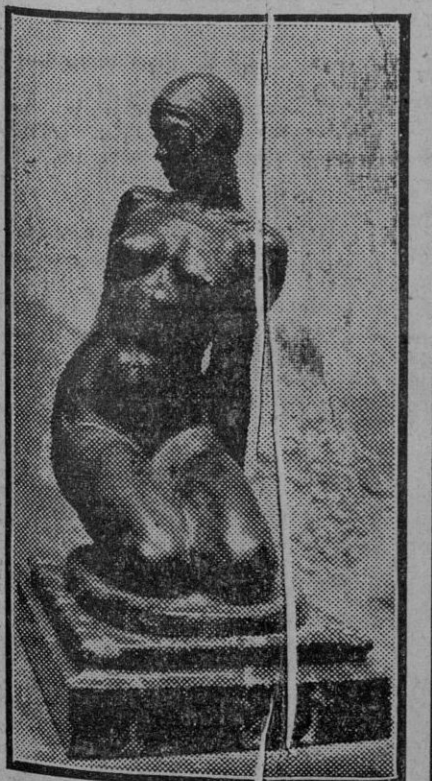
El ilustre escultor Agustín Sánchez-Cid, ha enviado á la Exposición Nacional de Bellas Artes, que se inauguraré en Madrid en breve, las dos hermosas obras que reproducimos. Son dos estatuas, desnudas de mujer, en bronce y en pie-

El hecho de haber cerrado el comercio, observando el carácter mimical dado al día de hoy por la reciente disposición del ministerio del Trabajo, ha dado ocasión para que el propósito conmemorativo se haya logrado rotundamente, como era de esperar.