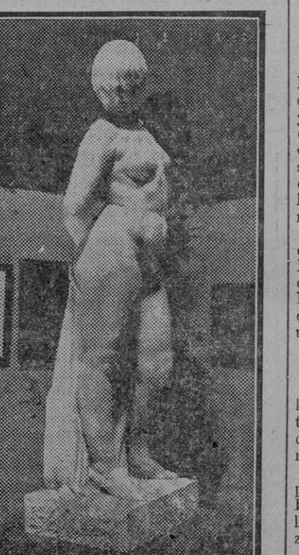
dra, magistralmente interpretadas y ejecutadas por el insigne artista sevillano. Reciba nuestra enhorabuena con la esperanza de que obtengan el galardón que merecen. (Fdo. Gori.)