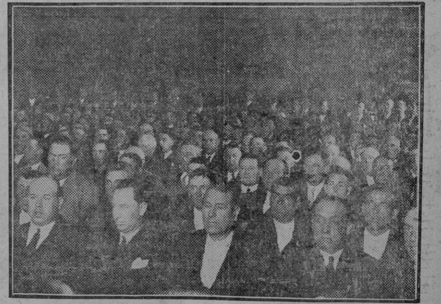
MADRID.—Un aspecto del salón de actos del ministerio de Agricultura durante la sesión inaugural de la A samblea á la que acudieron representaciones de todas las regiones de España. (Foto. Agencia Gráfica.) (Fdo. Gori.)