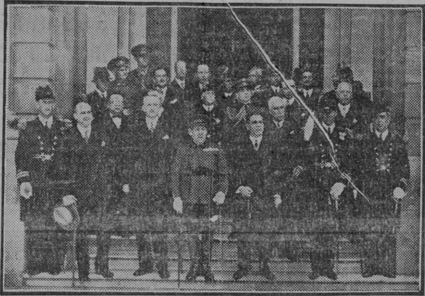
Las autoridades en la escalinata de la Casa Municipal

Terminada la revista, el general con su ayudante y jefes de Estado Mayor, descendieron de los caballos