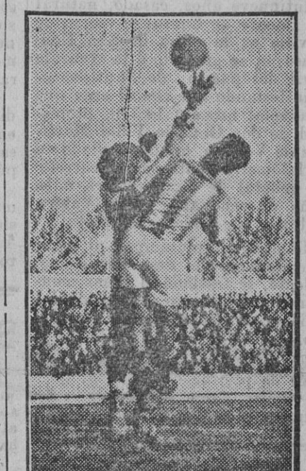
Un despeje de Etraguire en el partido de ayer