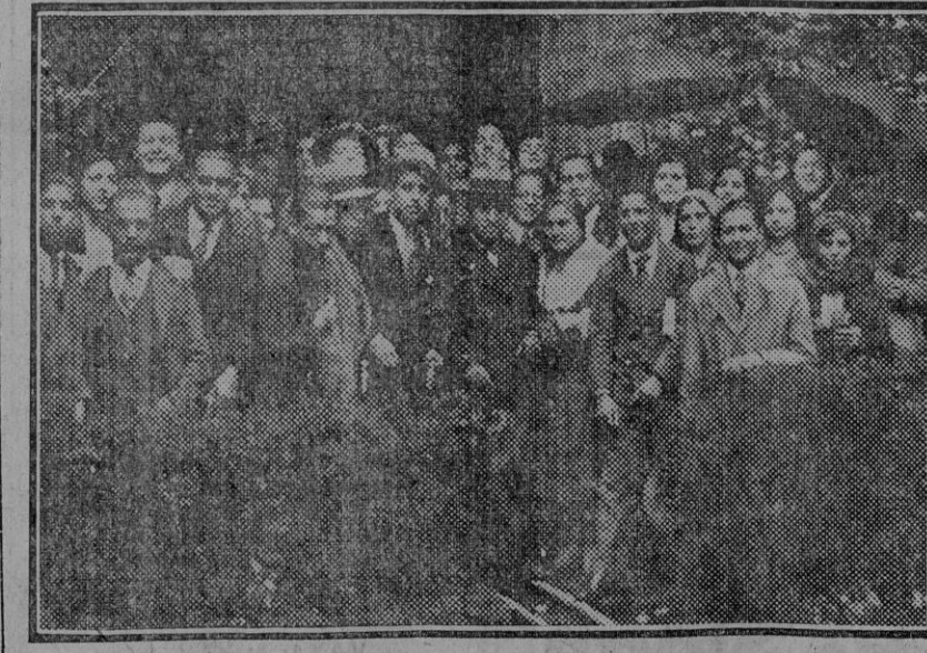
Los estudiantes del Magisterio pertenecientes á la F. U. E. que hicieron una visita colectiva al Alcázar. (Fdo. Sánchez del Pando).