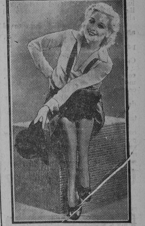
Thelma Todd, la hermosa rubia de las frívolas comedias cinematográficas.

Madrid 8.—La «Gaceta» publica un decreto referente á los estudios de la carrera de Veterinaria, organizada con arreglo al del 7 de Diciembre, distribuidos en cuatro cursos, considerándose como facultativos y otorgándoseles el grado académico de Licenciado, en Zootecnia. Los dos semestres de estudios superiores que por el mencionado decreto se cursen en la Escuela Superior de Madrid, serán consagrados con el título de Doctor en Zootecnia. Para la más perfecta y armónica delimitación entre las actividades respectivas de Veterinaria y de la Ingeniería Agrónoma, se nombrará una Comisión integrada por dos ingenieros agrónomos designados por su escuela; dos profesores de Veterinaria, nombrados por la suya en Madrid, y un profesor de la Facultad de Ciencias de la Universidad Central, y por un vocal delegado del Gobierno, que será quien la presida.