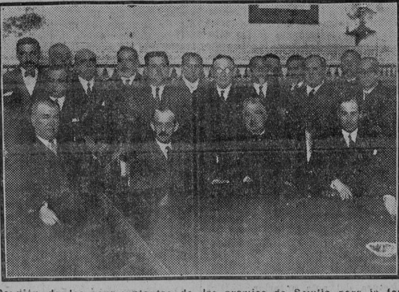
Reunión de los representantes de los gremios de Sevilla para la formación del Consejo Consultivo en la Federación Económica de Andalucía.

JEFE HINDU CONDENADO Bombay.—El «pandit» Jawaharlal Nehru, que había sido detenido por infracción de la orden que le prohíbe salir de la ciudad, ha sido condenado á dos meses de prisión y al pago de una multa de quinientos rupias.