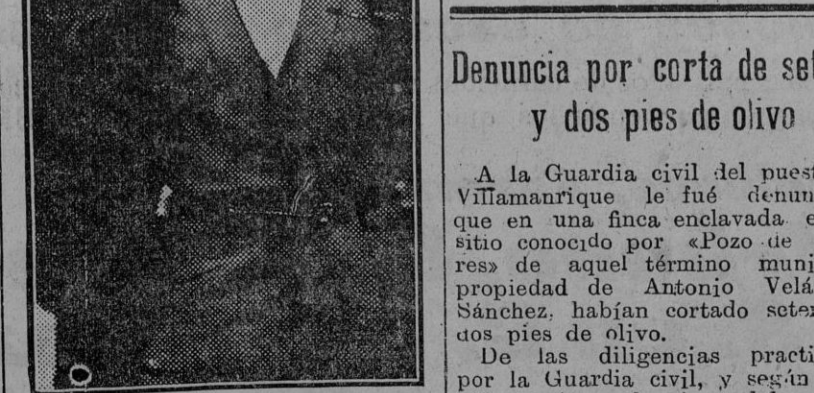
La gran bailarina española Antonia Mercé «La Argentina», á bordo del «Brema» á su regreso á Nueva York.

Sobre la agresión á un cónsul Tokio 8.—El ministro de Negocios Extranjeros ha informado que un centinela japonés pegó é hirrió levemente al cónsul de los Estados Unidos en Mukden, Mr. Calver Chamberlain. Se cree que el Gobierno japonés presentará sus excusas si se prueba que el centinela fue culpable, estimándose que este incidente no tendrá consecuencias serias, atendido que es una simple confusión de lengua parece haber sido la causa principal.