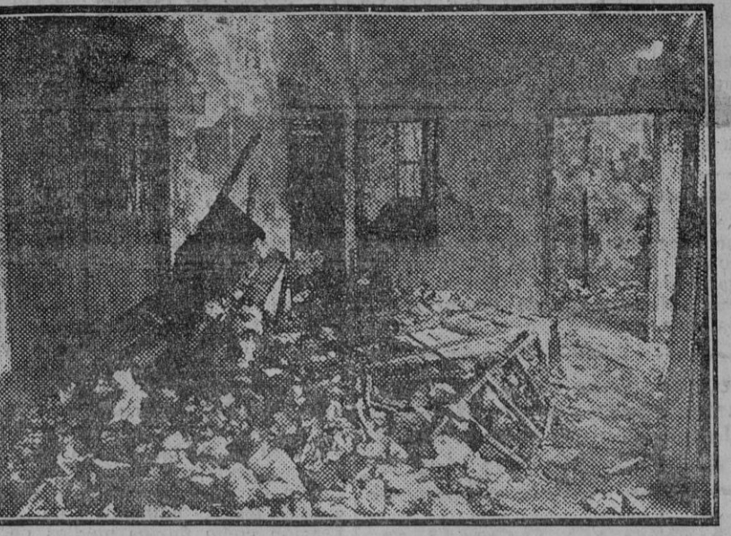
Aspecto de la planta alta de uno de los departamentos del edificio de calle Acetres, donde la Ciudad de Londres tenía instalados sus almacenes y cuyo local no estaba aun guizado. Como se ve por la foto, los daños han sido de gran consideración.