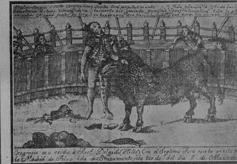
LA MUERTE DE PEPEHILLO