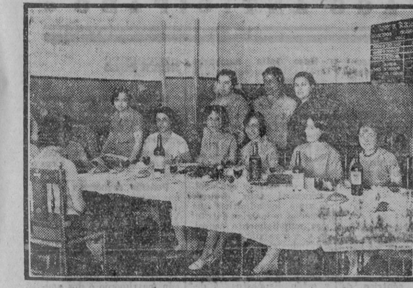
Dada la intensificación de servicios, ocasionada por el conflicto, las señoras reponen fuerza en la misma Central

finalidad que aumentar la división del personal ante el temor de que por el Gobierno se pueda decretar la incautación de los servicios, legado el caso de que no pueda seguir presionados. Hace determinadas consideraciones sobre otras organizaciones que integran el personal de Teléfonos, en relación con el pleito que actualmente se está ventilando, y añade que las notas oficiosas que se facilitan por el Gobierno son tendenciosas, ya que el actual ministro del Trabajo no ve con simpatía la huelga, por espíritu de partido.