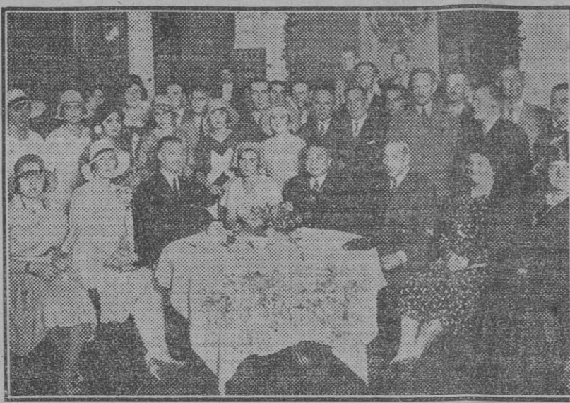
Acto con que se festejó ayer el aniversario de la independencia mejicana.