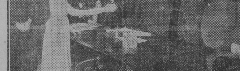
Reparto de premios á las aprendizas que han tomado parte en el concurso organizado por la Asamblea regional de la Sastrería Andaluza

La Unión Nacional de Abogados comenzará inmediatamente diversas campañas encaminadas á la defensa de su programa, teniendo el propó- sito de publicar en breve plazo una revista profesional.