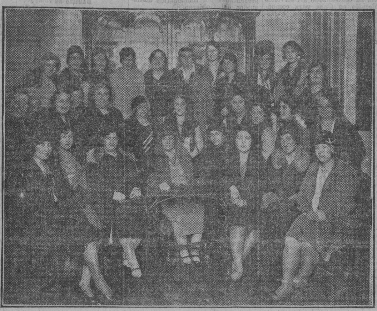
Grupo de algunas de las concurrentes ayer tarde en nuestra Redacción a la reunión celebrada para organizar el Ateneo Femenino, a cuyo acto prestaron su entusiasta concurso numerosas señoras y señoritas de distintas clases sociales.

Uso indebido de nombre Artículo 410.—«El que sin estar legalmente autorizado para ello, usare públicamente un nombre que no sea el suyo...»