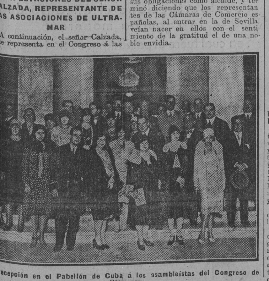
Recepción en el Pabellón de Cuba á los asambleístas del Congreso de Ultramar.