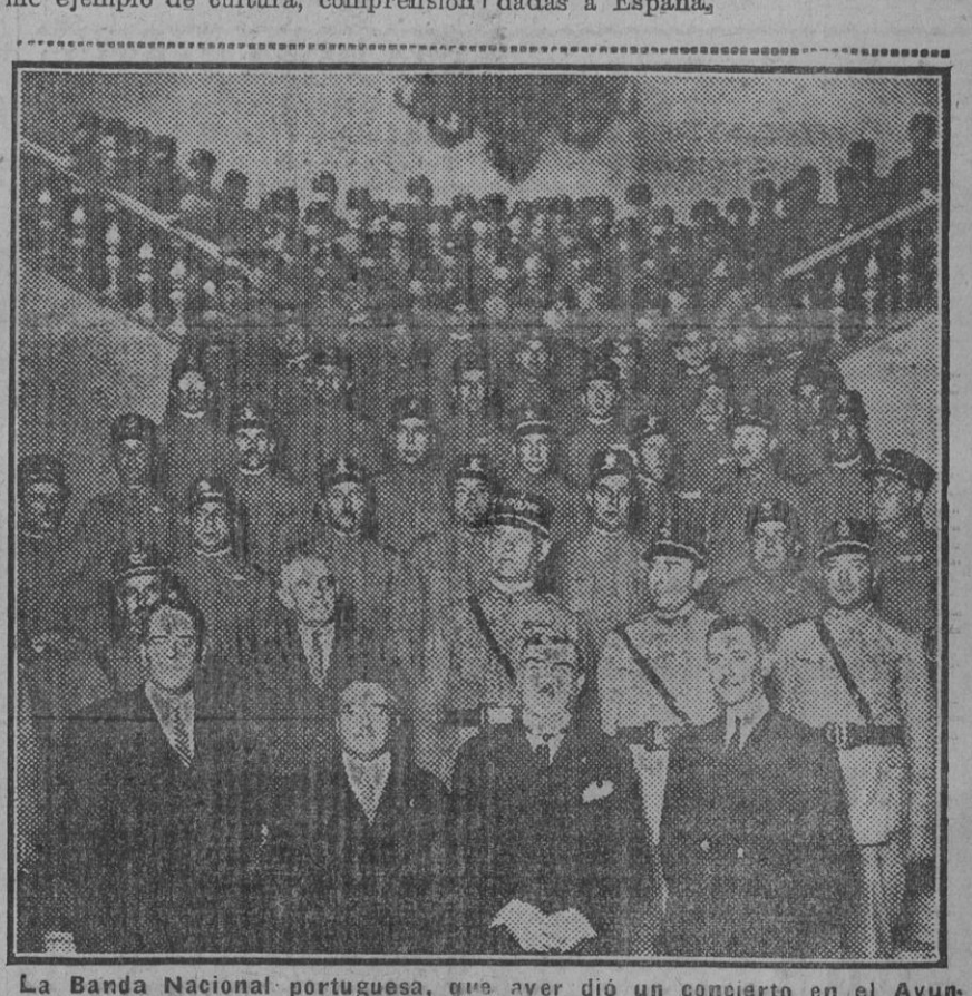
La Banda Nacional portuguesa, que ayer dió un concierto en el Ayuntamiento.