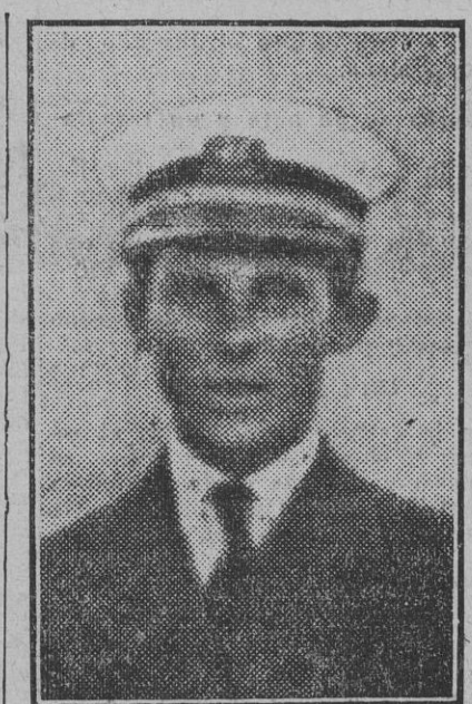
El capitán del yate "Mary".