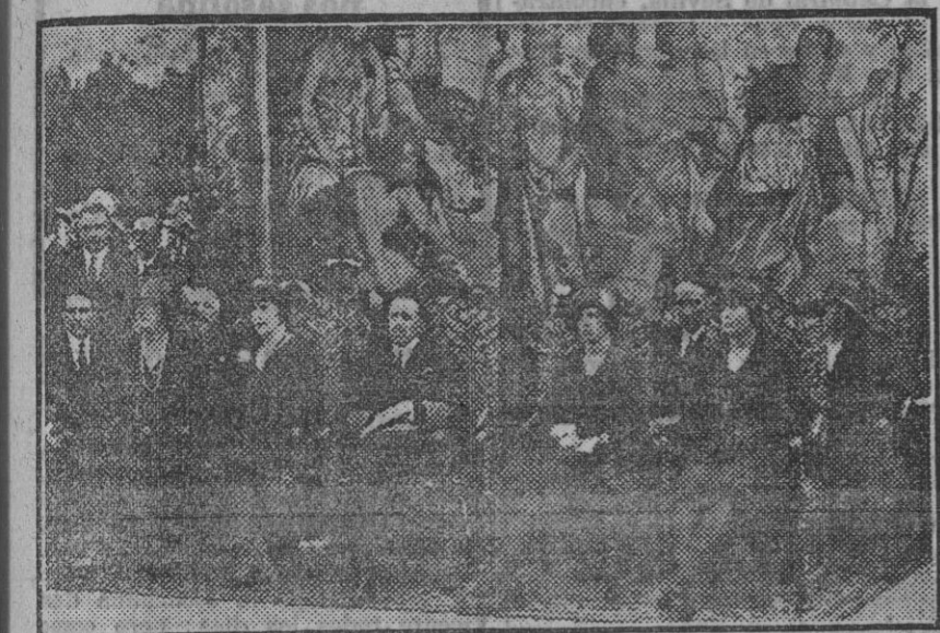
SS. MM. los Reyes y sus augustas hijas durante el concierto celebrado en la Plaza de España por el Orfeón Vasco.

Esta mañana zarpó de nuestro puerto la división portuguesa que ha asistido a los actos inaugurales de la Exposición