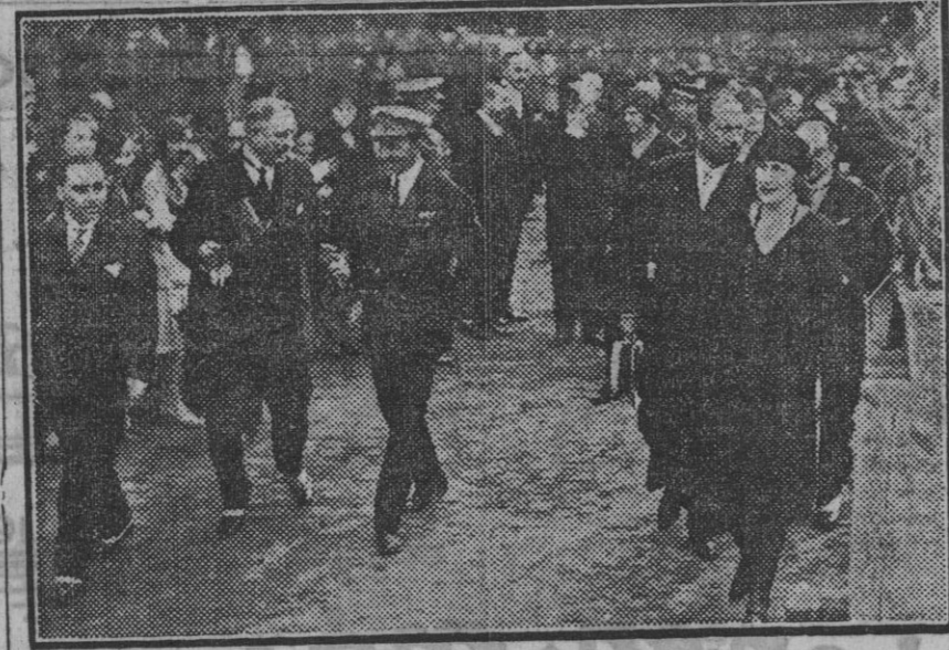
SS. MM. los Reyes durante la inauguración del pabellón de Teléfonos en Exposición Ibero-Americana.

Grupo de asistentes al almuerzo con que fueron obsequiados los periodistas extranjeros.