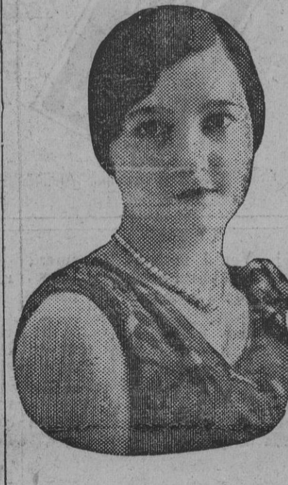
DE NUESTRO CONCURSO DE BELLEZA. Número 169.—SEVILLA. Lema: EN SEVILLA NACI.