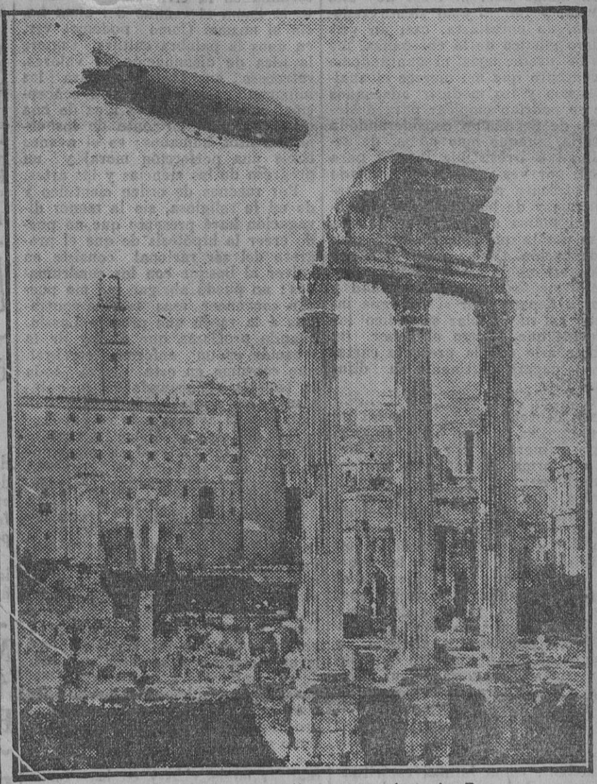
Paso del «Gonde Zeppelin» por encima de Roma.