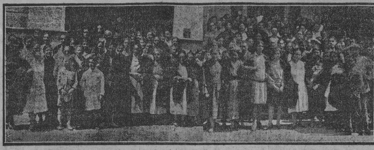
Comisiones de vecinos de las barriadas del Tiro de Línea y del Juncal, y del Ayuntamiento, donde estuvieron para exponer los perjuicios que se brevisimo sus modestas viviendas saliendo de la Capitanía General se les irroga al levantar un pla-

Comunica, por último, el delegado regio-presidente a los vocales de la Junta que la próxima asamblea general de la Confederación, cuyo objeto principal será discutir y votar el proyecto de Reglamento definitivo de la Confederación, se celebrará el día 1 del próximo Mayo.