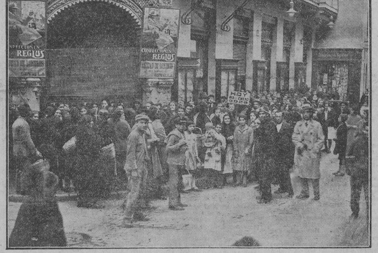
Aspecto que presenta diariamente la CIUDAD DE LONDRES esperando el público que abren sus puertas para hacer sus compras.