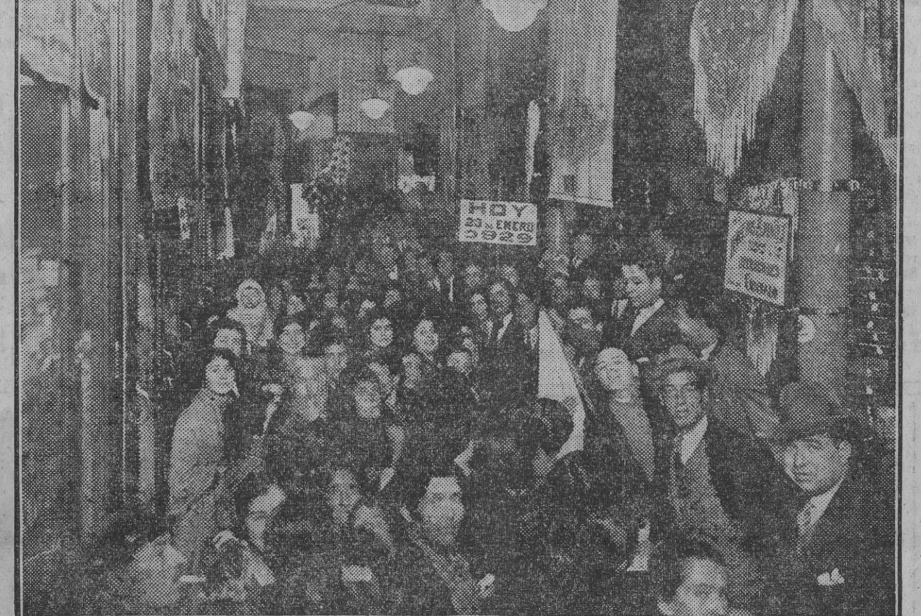
Interior de la CIUDAD DE LONDRES. El público acude a esta casa convencido de que sus precios no los puede igualar nadie. En tejidos y confecciones es la casa más popular de España.

Esta es la pura verdad.- Los precios de la CIUDAD DE LONDRES, han sido y serán siempre los más baratos en toda clase de tejidos. - Tienen despacho en el bajo, entresuelo y principal. - CERRAJERIA, esquina a CUNA