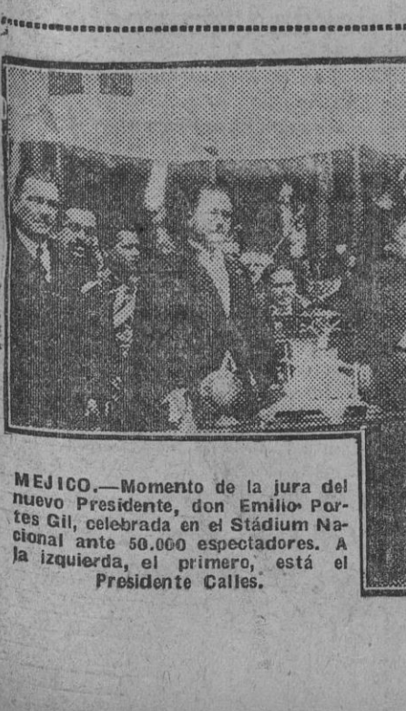
MEJICO.—Momento de la jura del nuevo Presidente don Emilio Portes Gil, celebrada en el Stadium Nacional ante 50.000 espectadores. A la izquierda, el primero, está el Presidente Calles.

Este número de EL LIBERAL consta de 6 páginas