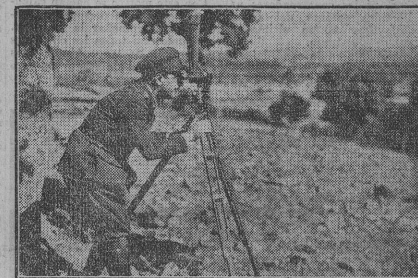
Nuestro redactor militar observando el avance de la Infantería.

Bien temprano se ha salido al campo para el ejercicio final de conjunto. Este es culminación de los realizados en días anteriores. Supónese que la división que opera tiene por misión sacar el fruto