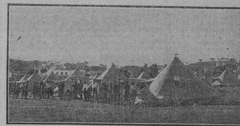
Un aspecto del campamento del Regimiento de Soria número 9, á la hora del descanso.

A esperar á los expedicionarios acudirán todos los jefes y oficiales de los citados Cuerpos que estén francos de servicio.