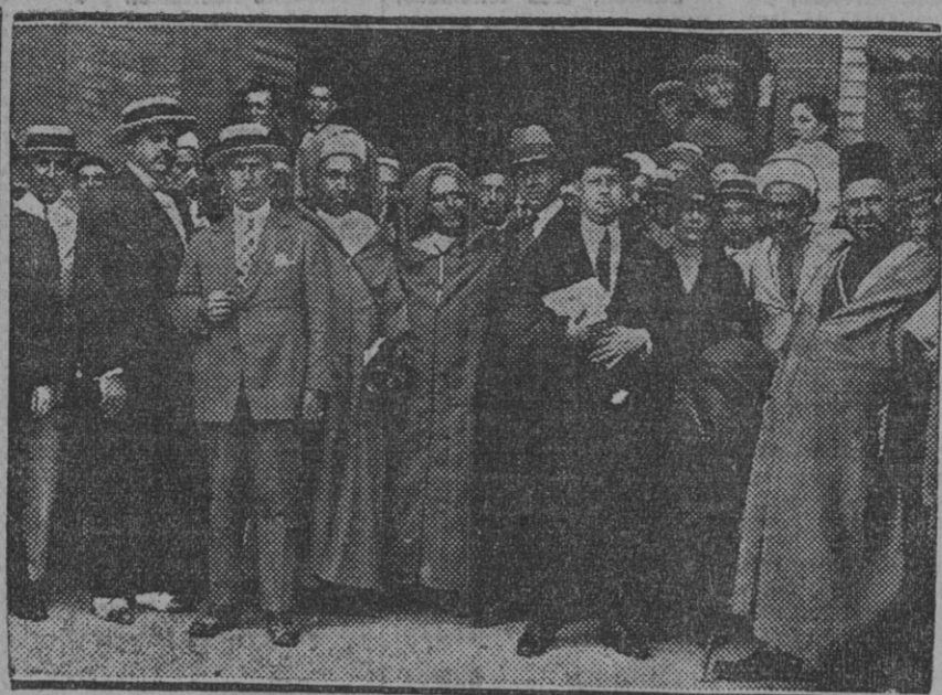
Los hajes de Larache y Alcázar, el mudden de Tetuán, moros notables del séquito y los cónsules de Larache, Tetuán y Alcázar á su llegada ayer á Sevilla

Hoy, después de volar con el comandante Lecca en una avioneta, nos dijo el ilustre piloto que la joven es listísima y que tiene una afición desmedida á la aviación. No faltanos ha agregado—ni un solo día al campo de aviación, y en verano se presenta á las cinco de la mañana y retorna á Madrid por la tarde, sin faltar jamás. Yo creo—termina diciendo el comandante—que llegará muy pronto á ser un caso de la aviación española.