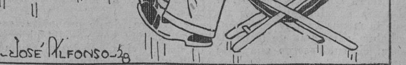
—Papá, yo me quiero bañar con la chacha. —No es posible. ¿No ves que es un ama seca?