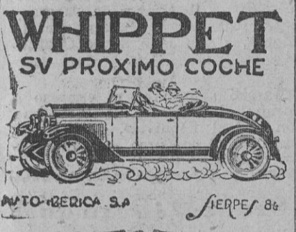
WHIPPET SV PROXIMO COCHE

CASA OLIVERAS. Alonso el Sabio, 3. Por una peseta le deja el sombrero de paja nuevo en 24 horas. — Fútbol — El próximo domingo, en el campo de Las Carolinas, se celebrará un partido amistoso entre los equipos de esta localidad Hispánica F. O. y Victoria F. C.