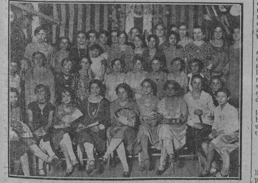
Guapas y simpáticas trianeras concurrentes a la caseta del Club Recreativo.

Roma. — El domingo próximo partirá para Australia el cardenal Bonaventura Cerretti, legado del Pontífice en el Congreso Eucarístico Internacional XXIX, que se ha de inaugurar en Sidney en los primeros días de Septiembre. Le acompañarán los monseñores Mell y Respighi, condes de Hearn y Mindela, camareros secretos del Pape, y su corte noble. El Congreso promete un brillante éxito, dado el entusiasmo del Comité presidido por el obispo apostólico monseñor Cattaneo, que no cmite esfuerzo alguno en los preparativos. El legado pontificio llegará a Sidney, en el barco «Dranna», el 30 de Agosto, y será recibido por las autoridades y el Comité. El cardenal Cerretti, será portador de un cáliz que Su Santidad regala a los católicos de Sidney. Este cáliz es de oro y brillantes, teniendo un gran valor intrínseco y artístico. El cardenal Cerretti, después del Congreso, visitará Brisbane, donde bendecirá la primera piedra de la catedral, y Melbourne, donde inaugurará los nuevos edificios del Colegio Werribee, y después Waga y Canberra.