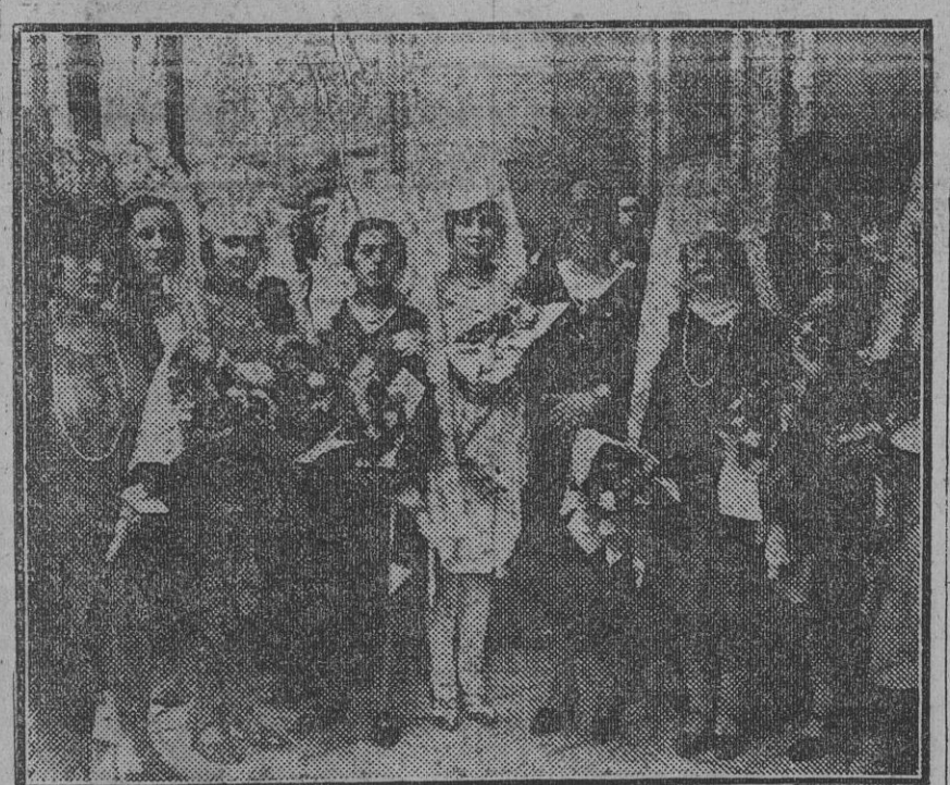
Señoras y señoritas que presidieron el reparto de premios y meriendas a los niños de las escuelas del barrio de San Bernardo. (Fdo. Gori.)