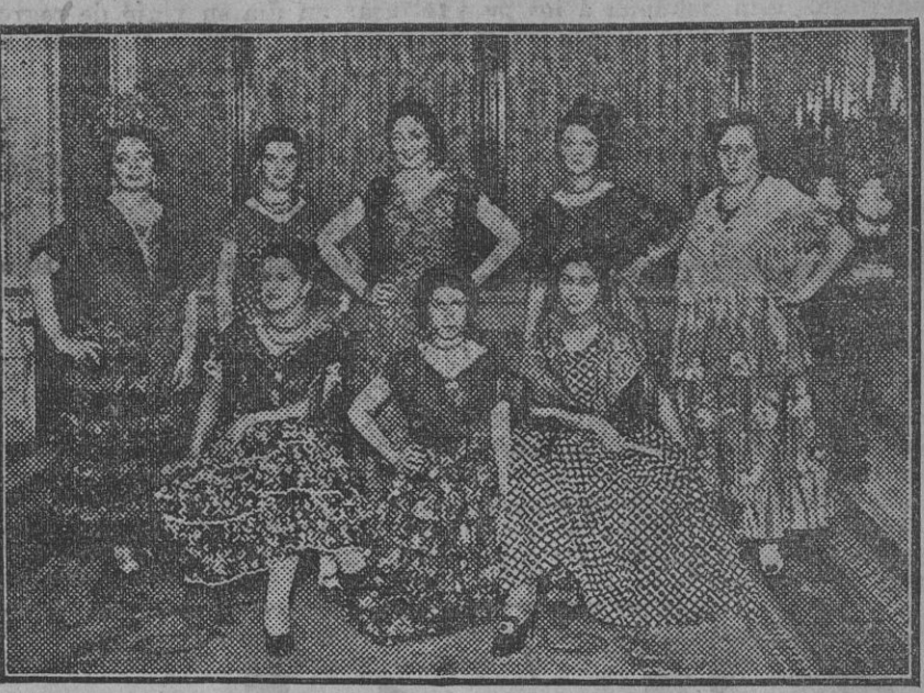
Señoritas de la aristocracia que tomaron parte en el festival celebrado a beneficio de la Asociación de Caridad y Cruz Roja.