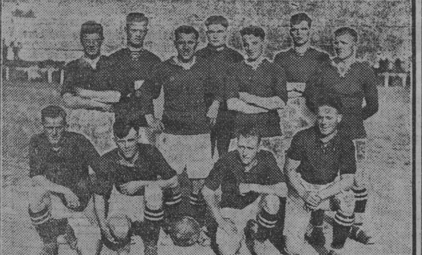
Equipo del Gibraltar F. O. que jugó ayer un partido con el Real Betis Balompie.