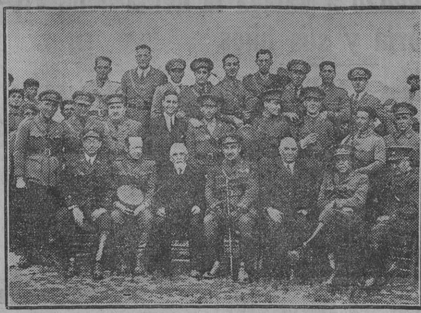
Jefes y oficiales de Intendencia con el alcalde y primer teniente de alcalde de Coria del Río, después del almuerzo con motivo de las manifestaciones verificadas por dichas fuerzas en el citado pueblo.

acompañarle 107 cupones para el sorteo del tercer sorteo de Febrero corriente, entre cuyos números tengo la satisfacción de enviarle el en que ha de caer el premio «gordo» del dicho sorteo del día 21. Como soy lector asiduo desde mucho tiempo del simpático LIBERAL de Sevilla, que usted tan dignamente dirige, ya me informaré de todo lo que sobre este concurso vaya ocurriendo. Aprovecho esta ocasión para ofrecerme de usted como su más atento y afectísimo seguro servidor que le estrecha la mano. Está más alegre que unas Pascuas. Y sus padres también. Por su domicilio han desfilado numerosísimas personas para felicitar al afortunado joven. En La Palma y Huelva se comenta hoy la buena suerte de la provincia en los concursos de EL LIBERAL. No es buena suerte, señores. Es lista. Aquí se oye crecer la yerba. Hay mozo en esta tierra, que le dice a ustedes ahora mismo, cómo se llamará el primer aviador que aterrice en el planeta Marte. Huelva y su provincia siguen con el santo de cara. ¡Pues que siga mirándonos! Pepe de la Rabida.