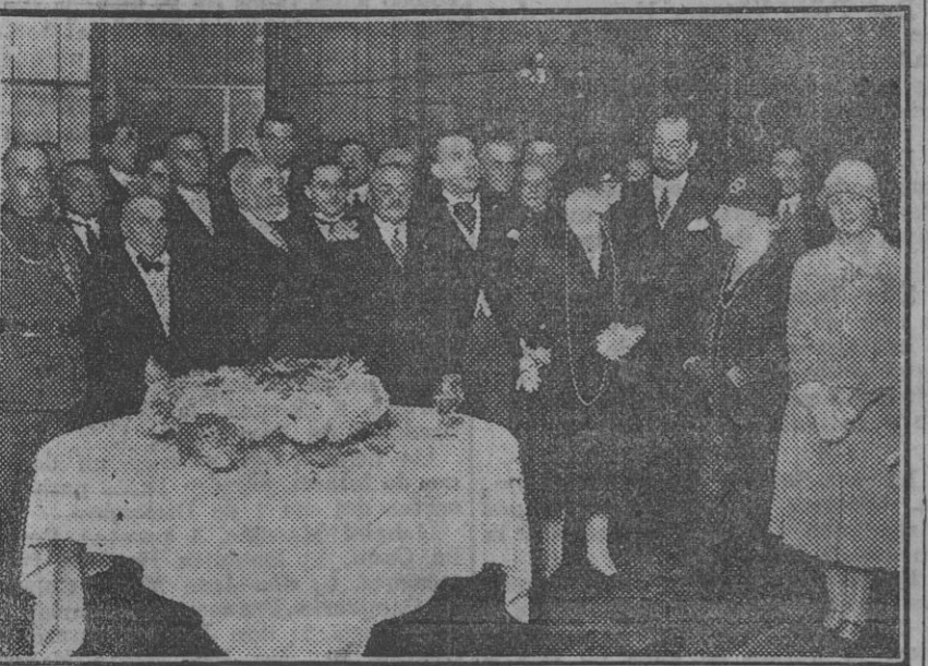
Concurrentes al té con que obsequió ayer tarde el ministro de Chile a las autoridades, Comité de la Exposición y distinguidas personalidades.