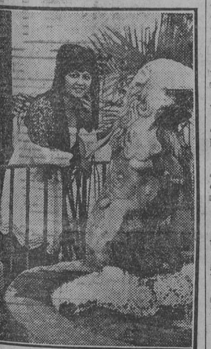
Y el rey de la selva, como cualquier perrito faldero, al sentir la proximidad de la hembra, le ofrece el homenaje de su admiración con la más graciosa de sus piruetas.

el palco frontero asoma la silueta desgarbada, pero simpática, del otro espada «cañí», el hijo de Curro Puyá. Los dos asientan a Custodia, la morena que no es sevillana. No han faltado una noche al espectáculo. Joaquín y Currito son buenos amigos, pero el diablo se mete en sus cosas y casi siempre andan encontradas. Triunfa una gitana en el palco, y el día que tratan de celebrar el triunfo se encuentran, se saludan desde lejos, se recriminan interiormente, y cuando distraídos lanzan la mirada a otro sitio, se vuelven a encontrar los ojos. No es que se buscan; es que se encuentran.