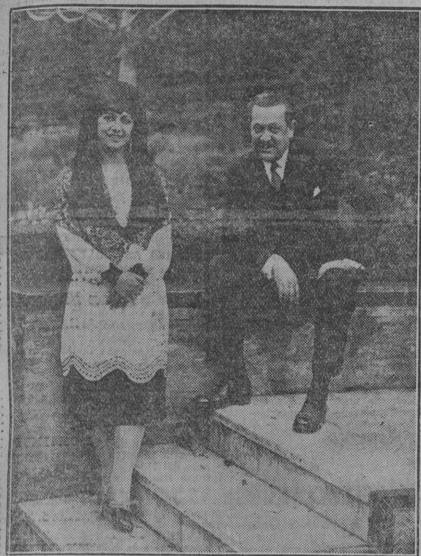
Antes de comenzar la confesión, la penitencia y el «confesor» posan unos momentos ante el objetivo. Y por anticipado: «Ego te absolvo».

para el que hay que pedirle permiso al papá. Yo no hago más que cosas de la tierra, bailes «cañí», arreglados por mí misma, que soy «ami maestra».