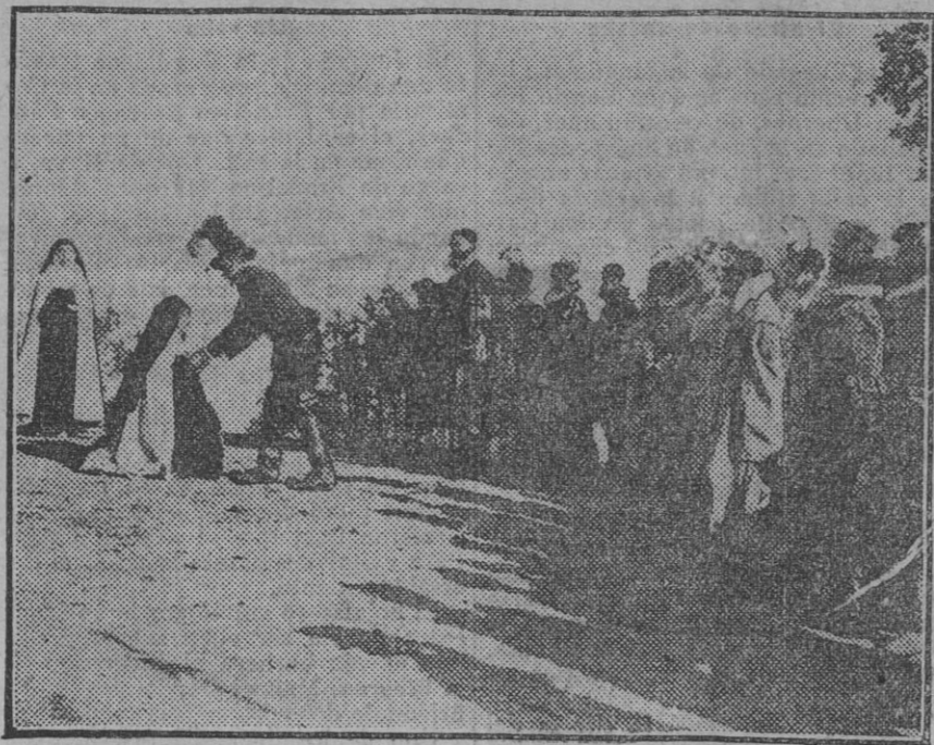
EL ESCORIAL.—Santa Teresa de Jesús ante Felipe II pidiendo su protección para la reforma de la Orden del Carmelo. Episodio bellamente representado en el festival histórico celebrado con motivo del IV centenario de Felipe II.