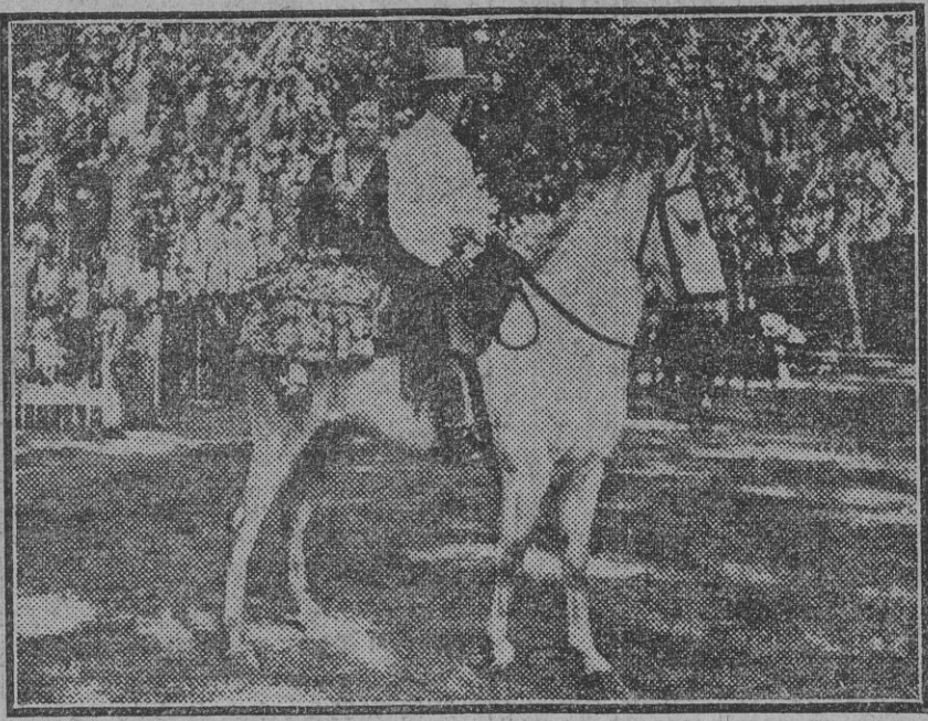
SS. AA. los Infantes Don Carlos y Doña Isabel Alfonsa, paseando a caballo en la fiesta de Tablada.

Segunda. Es de imperiosa necesidad un ordenamiento o estatuto de la carrera mercantil, en consonancia con sus fines propios y con las exigencias de la vida actual, dando un decisivo papel al factor económico. En todas las na-